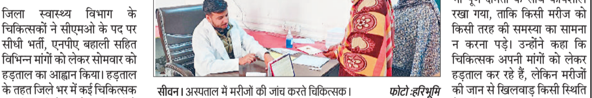
सीवन। अस्पताल में मरीजों की जांच करते चिकित्सक।

चिकित्सकों की हड़ताल के बावजूद मरीजों की सेवाएं जारी हरिभूमि न्यूज ॥ सीवन जिला स्वास्थ्य विभाग के चिकित्सकों ने सीएमओ के पद पर सीधी भर्ती, एनपीए बराली सहित विभिन्न मांगों को लेकर सोमवार को हड़ताल का आह्वान किया। हड़ताल के तहत जिले भर में कई चिकित्सक अपनी इ्यूटी से दूर रहे। इसी कड़ी में सामुदायिक स्वास्थ्य केंद्र सीवन में भी दो चिकित्सक हड़ताल में शामिल हुए। इसके बावजूद मरीजों को किसी प्रकार की दिक्कत न हो, इसके लिए स्वास्थ्य केंद्र प्रशासन ने पहले से ही आवश्यक व्यवस्थाएं