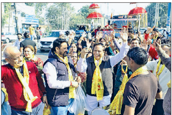
कुरुक्षेत्र। साईं रथ के आगे नाचते भक्तजन।

साईं रथ के धर्मनगरी में प्रवेश करते ही भक्तों ने फूल बरसाए, पादुकाएं खुले वाहन में शोभायात्रा के रूप में होटल सैफरॉन तक लाई गईं