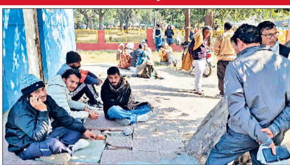
जींद। अस्पताल में पोस्टमार्टम के लिए आए मृतक परिजन।

आने दी परेशानी: नागरिक अस्पताल में इमरजेंसी में आने वाले मरीजों के उपचार को लेकर स्टाफ नर्स, प्रशिक्षु चिकित्सकों ने कमान संभाली। ज्यादा गंभीर मरीजों को तुरंत प्रभाव से रोहतक का रास्ता दिखाया गया। सबसे ज्यादा परेशानी हड्डी के रोगियों, मनोचिकित्सक, इंटर्नी व आप्रेशन को लेकर हुई। हड्डी, मनोचिकित्सक, इंटर्नी के मरीजों को बिना उपचार के ही वापस जाना पड़ा। क्योंकि उन्हें