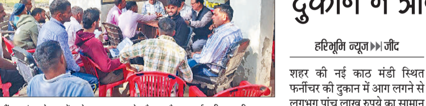
राजौड़। गांव कोटडा में लगे खुल दरबार के दौरान मौजूद कर्मचारी व ग्रामीण।