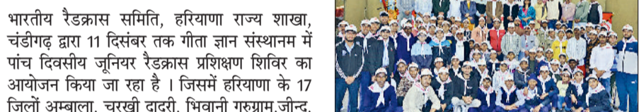
कुरुक्षेत्र। शिविर में शामिल स्वयंसेवक।