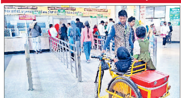
जींद। अस्पताल में उपचार के लिए आए दिव्यांग परेशान होते हुए।