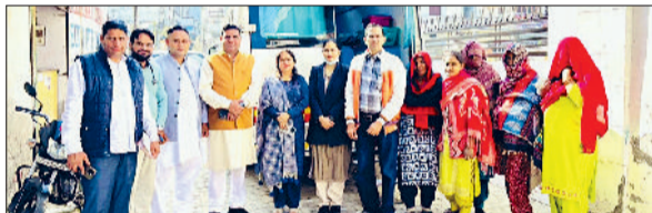
पूडरी। रसीना में नवीन जिनदल मेडिकल यूनिट लोगों की स्वास्थ्य जांच करते हुए।

ग्रामीणों तक मूलभूत स्वास्थ्य सुविधाएँ पहुँचाने के उद्देश्य से नवीन जिनदल फाउंडेशन द्वारा संचालित मोबाइल मेडिकल यूनिट लगातार जन-सेवा का महत्वपूर्ण माध्यम साबित हो रही है। इसी प्रयास को आगे बढ़ाते हुए आज मोबाइल मेडिकल यूनिट पूडरी हल्के के रसीना गाँव पहुँची, जहाँ बड़ी संख्या में ग्रामीणों ने पहुँचकर निःशुल्क जाँच और उपचार का लाभ उठाया। मोबाइल मेडिकल यूनिट के डॉक्टरों ने ग्रामीणों की स्वास्थ्य जाँच कर विस्तृत परामर्श दिया तथा आवश्यकता अनुसार मुफ्त दवाइयाँ उपलब्ध कराईं। यूनिट में रक्त और मूत्र परीक्षण की सुविधा होने से लोगों