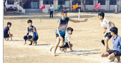
कैथल। खो खो खेलते ओएसडीएवी स्कूल के विद्यार्थी।